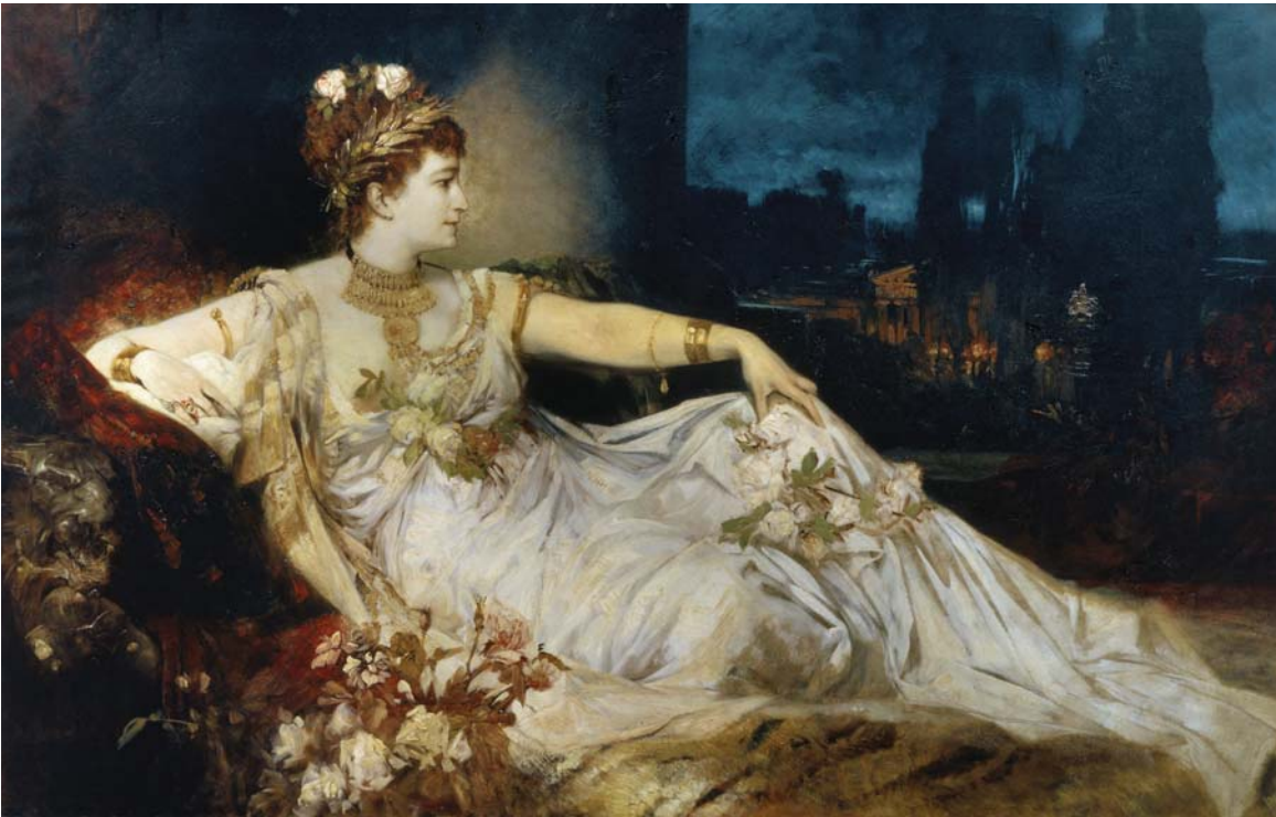
Hans Makart, Charlotte Wolter als Messalina, 1875 (Wien Museum)