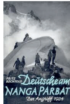
Verlag F. Brückmann