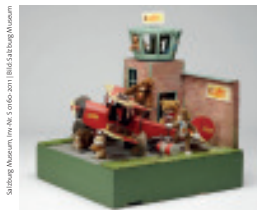
Flughafen-Modell mit Steiff-Tieren, um 1970