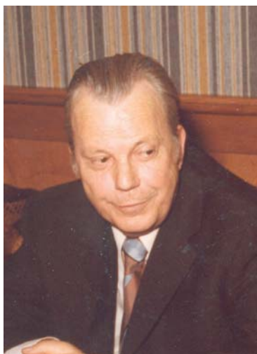
Bilder (9): privat

demuseum, dem Neuen Haus am Museumsplatz und dem Domgrabungsmuseum, die er mit seinem typisch militärischen Ton zu führen verstand. Mit dem 1967 eröffneten neuen Museumgebäude erweiterte sich sein Aufgabenbereich um die Organisation und die vielen Transporte sowie die Einrichtung zahlreicher Ausstellungen. Unter Dir. Frie-