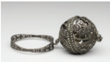
Silberner Garnhalter, 1. Drittel 19. Jahrhundert (Inv.-Nr. 186/31)