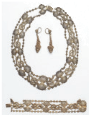
Silberne Schmuckgarnitur, 2. Hälfte 19. Jahrhundert (Inv.-Nr. 240/31)

Die vorwiegend klein- und mittelformatigen Gemälde fallen in erster Linie durch ihre sehr üppigen, vergoldeten, historisierenden Rahmen auf. Unter ihnen befinden sich zahlreiche Tierstücke, Genreszenen, Landschaften, Heiligendarstellungen und Schlachtschilderungen. Das wohl bekannteste Gemälde ist der „Sonntagsspazier-