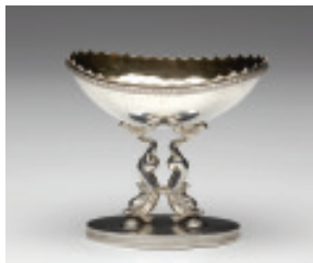
Salzgefäß, 1. Hälfte 19. Jahrhundert (Inv.-Nr. 42/31)

gang“ von Carl Spitzweg, doch auch viele andere Stücke stammen von herausragenden Malern.